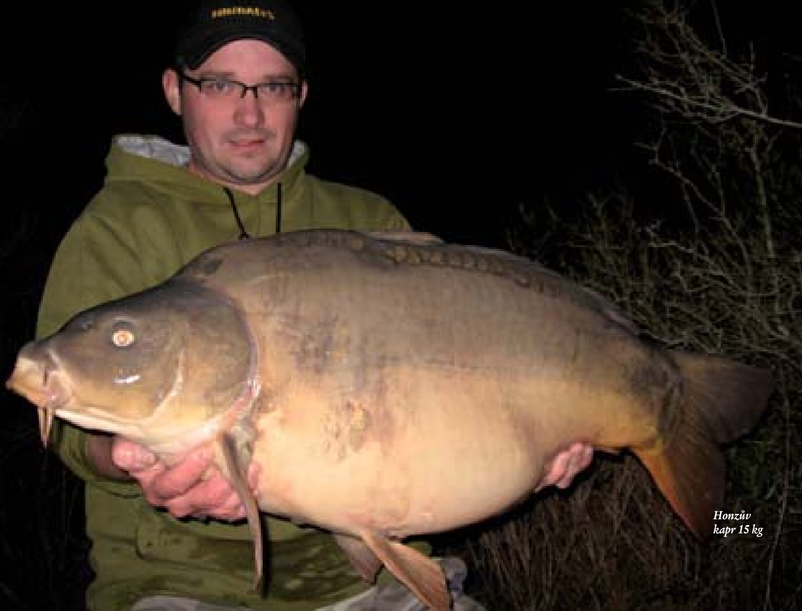
Honzův kapr 15 kg