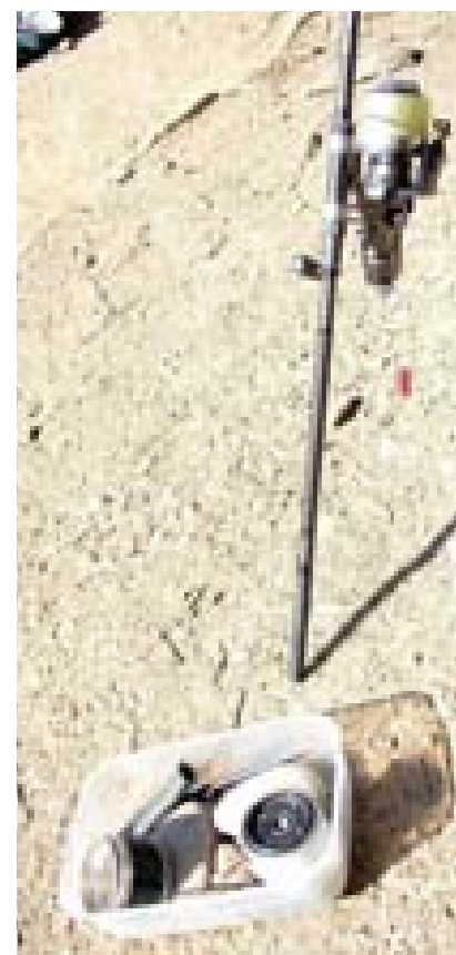
Vše připraveno na vyvážku přes 3 cívky a přes 1000 m!

20:04: - Čekali jsme to později, ale jsme mrtví smíchy! :-):-):-) Text od „CCC“: „Rafane, ty ku..o! Že bys mi dal vědět, cos chytnul:-). Tak kolik? 28,20kg! Kde sedíš! Podej nějaký info!“