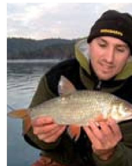
Rovnátko ze smršťovací hadičky lze mnohem lépe přizpůsobit a vytvarovat, navíc je i nenápadnější.

12:28 - Dnes jsem byl v marketu a pomohl jsem tam dvěma Čechům s pov-