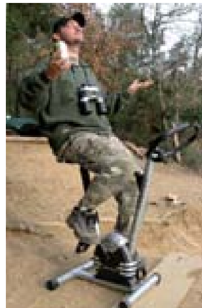
Rotoped na Cassienu