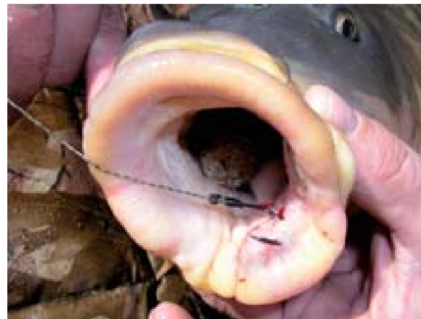
Rovnátko ze smršťovací hadičky lze mnohem lépe přizpůsobit a vytvarovat, navíc je i nenápadnější.

9:56 - ok, super. Dokoumáme to, až dorazíme:-). Trochu odlehčíme té napjaté kaprařské scéně:-).